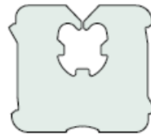
De "Clippis" sluiting van Schutte

Omdat merkhouders exclusieve rechten hebben op hun merk en merkregistraties onbeperkt verlengd kunnen worden, slaagde Kwik Lok er lang in concurrenten uit de markt te houden door (te dreigen met) gerechtelijke procedures wegens merkinbreuk. De New Yorkse rechter heeft daar nu op verzoek van Schutte een eind aan gemaakt door te beslissen dat de zaksluitingen "functioneel" zijn, en niet als merk gezien kan worden. Bovendien heeft de rechter beslist dat de Amerikaanse merkregistratie voor de vorm van de sluiting vernietigd moet worden. De rechter heeft ook aangegeven dat zelfs al zou er een geldig merkrecht zijn op de vorm van de sluitingen, er geen sprake kan zijn van verwarringsgevaar bij het relevante publiek als Schutte haar Clippis sluitingen op de Amerikaanse markt zou brengen.